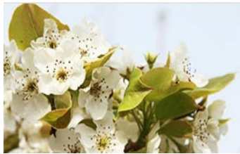
市の花 - 梨の花

梨は 史的に羅州の代表的な名産物である。花は市民の純潔性を表現し、花びらが一 に き散るので市民たちの固い意思と 結心を象