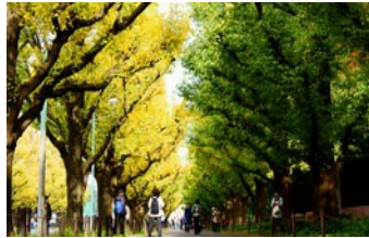
市の木 - 銀杏の木

梨は 史的に羅州の代表的な名産物である。花は市民の純潔性を表現し、花びらが一 に き散るので市民たちの固い意思と 結心を象