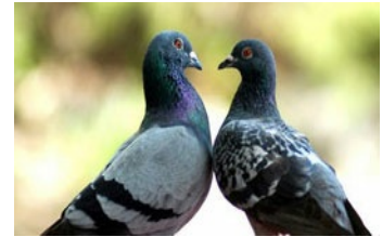
市の鳥 - 鳩