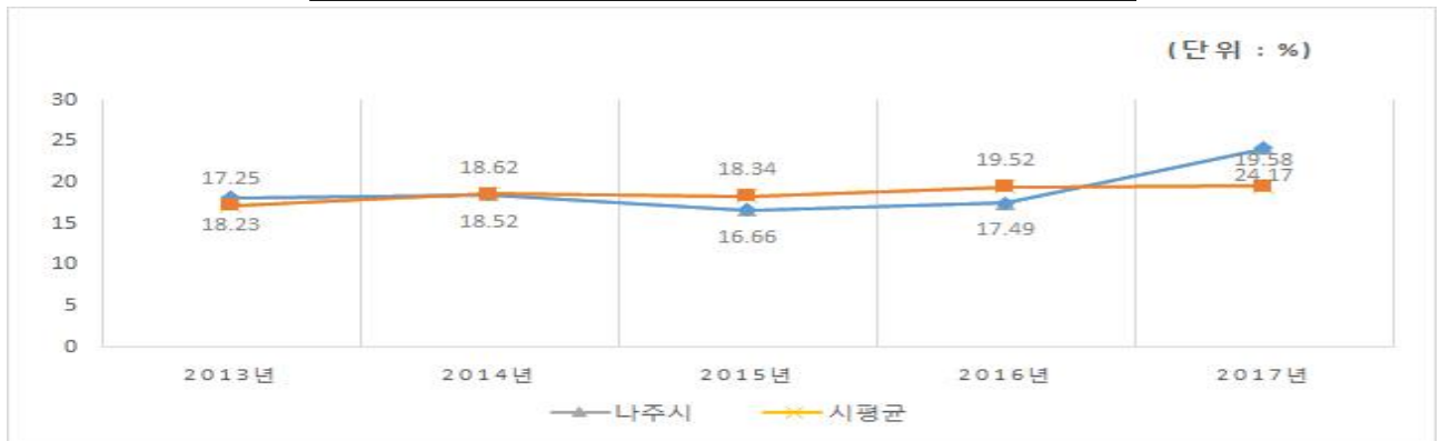
유사 지방자치단체와 재정자립도(당초예산) 비교