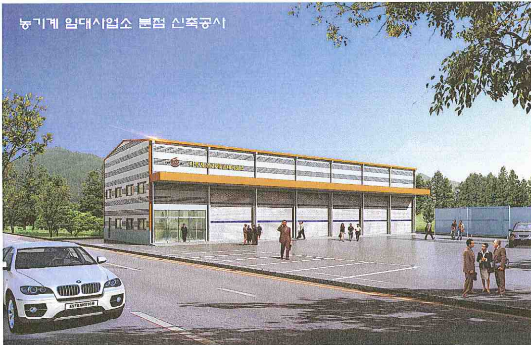
임대사업소 분점 투시도