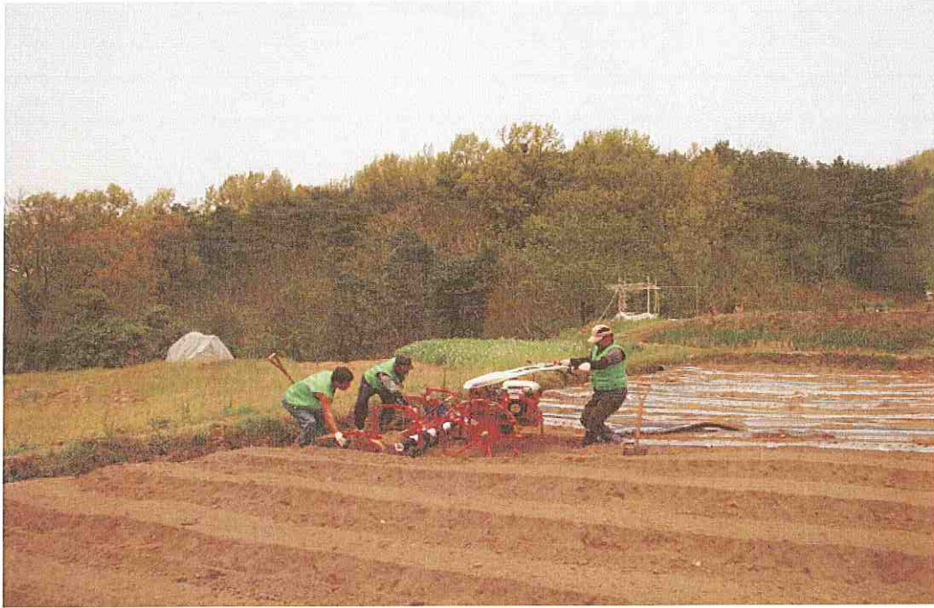
농작업 대행 (비닐피복)